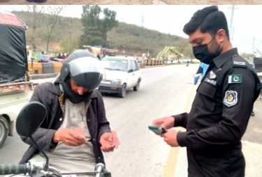
کا تحفظ اسلام آباد کیپیٹل پولیس کی اولین ترجیح ہے۔

اسلام آباد کیپیٹل پولیس آفیسر ڈاکٹر اکبر ناصر خاں کے خصوصی احکامات پر اسلام آباد کیپیٹل پولیس کا جرائم کے انسداد اور جرائم پیشہ عناصر کی سرکوبی کیلئے مختلف علاقوں میں سرچ اور کومنگ آپریشنز کا سلسلہ جاری ہے، اس سلسلے میں اسلام آباد کیپیٹل پولیس انسداد دہشتگردی ڈیپارٹمنٹ نے تھانہ بھارہ کہو کے مختلف علاقوں میں سرچ اور کومنگ آپریشن کیا، سرچ آپریشن میں سی ٹی ڈی اور مقامی پولیس ٹیموں نے حصہ لیا، سرچ آپریشن کے دوران 37 گھروں، 11 گاڑیوں، 23 موٹر سائیکلوں اور 75 مشکوک افراد کو چیک کیا گیا جبکہ 05 بغیر کاغذات موٹر سائیکلوں کو جانچ پڑتال کیلئے تھانہ منتقل کیا گیا، سینئر پولیس انسپران نے کہا کہ سرچ آپریشن کا مقصد جرائم پیشہ عناصر کے گرد گھیرائنگ کرنا اور شہر بھر میں سکیورٹی کو موثر بنانا ہے، سرچ آپریشنز ضلع بھر کے مختلف علاقوں میں کئے جا رہے ہیں، انہوں نے مزید کہا کہ اسلام آباد کیپیٹل پولیس کا جرائم پیشہ عناصر، قبضہ مافیا اور منشیات فروشوں کیخلاف بلا تفریق کارروائیوں کا سلسلہ جاری ہے، شہریوں سے بھی گزارش ہے کہ کسی بھی مشکوک سرگرمی کے متعلق متعلقہ تھانہ، "پکار-15" یا "آئی سی ٹی-15" ایپ پر اطلاع دیں، تاکہ پولیس اور عوام کے باہمی تعاون سے شہر کو جرائم سے پاک کیا جاسکے، کسی بھی عناصر کو شہریوں کے امن میں خلل ڈالنے کی اجازت نہیں دی جائے گی، شہریوں کی جان و مال